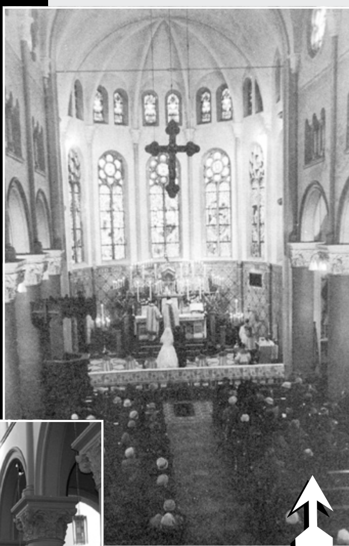
• Een van de laatste huwelijksluitingen in de kerk vóór de verbouwing.