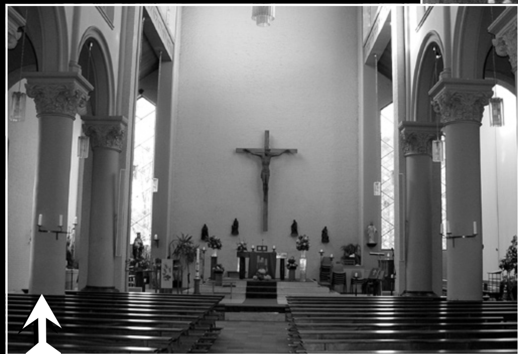
• Het interieur van de kerk