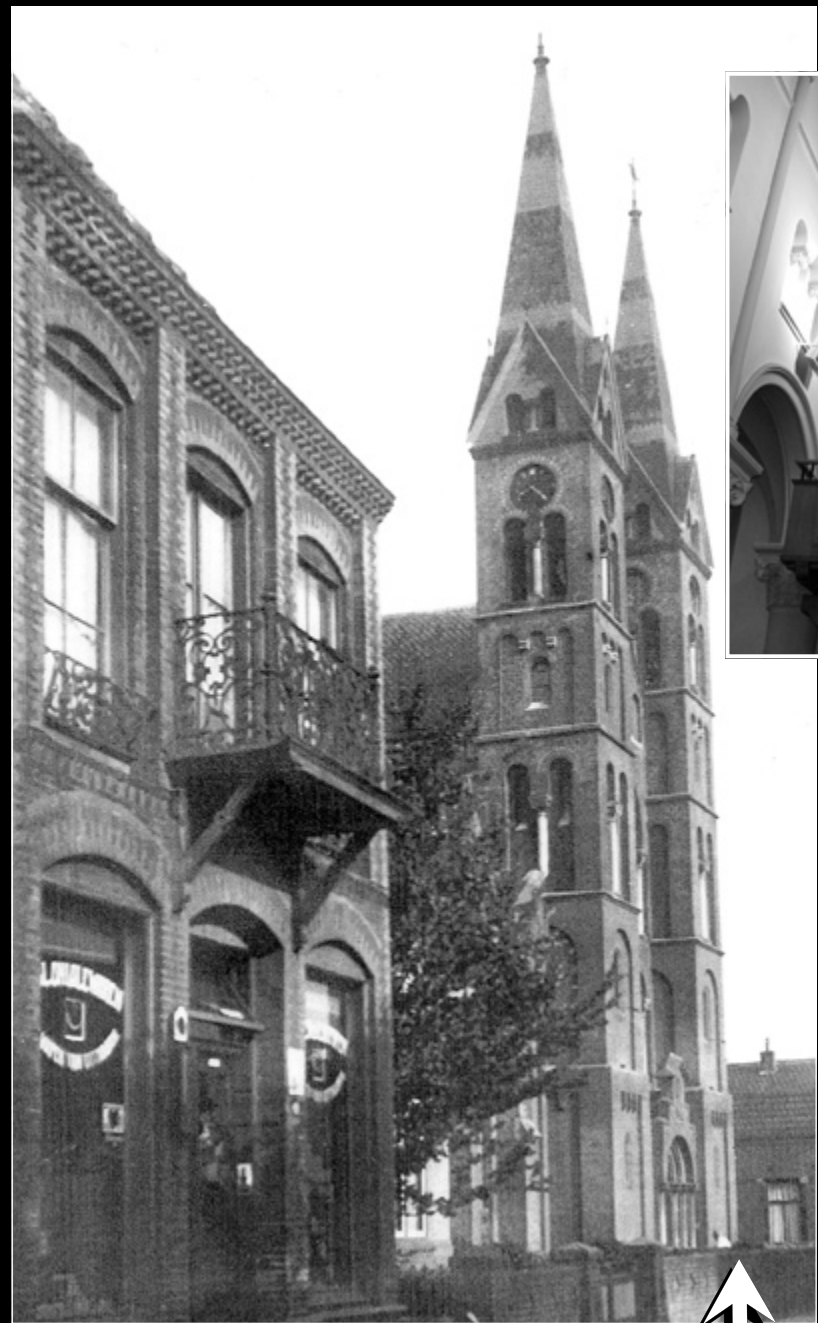
• De R. K. kerk aan de Schans